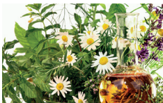
Kräuter, TEM, Pilze